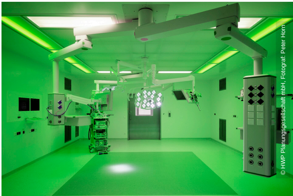
© HWP Planungsgesellschaft mbH, Fotograf: Peter Horn