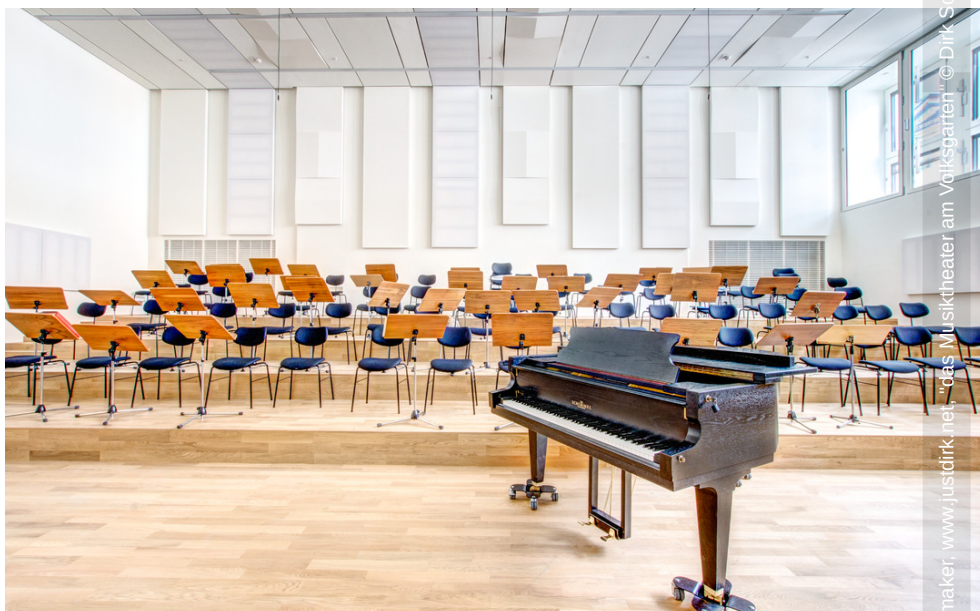
rik. Schoenmaker, www.justdirk.net, "das Musiktheater am Volksgarten" © Dirk Schoenmaker, www.justdirk.net, "das Musiktheater am Volksgarten"