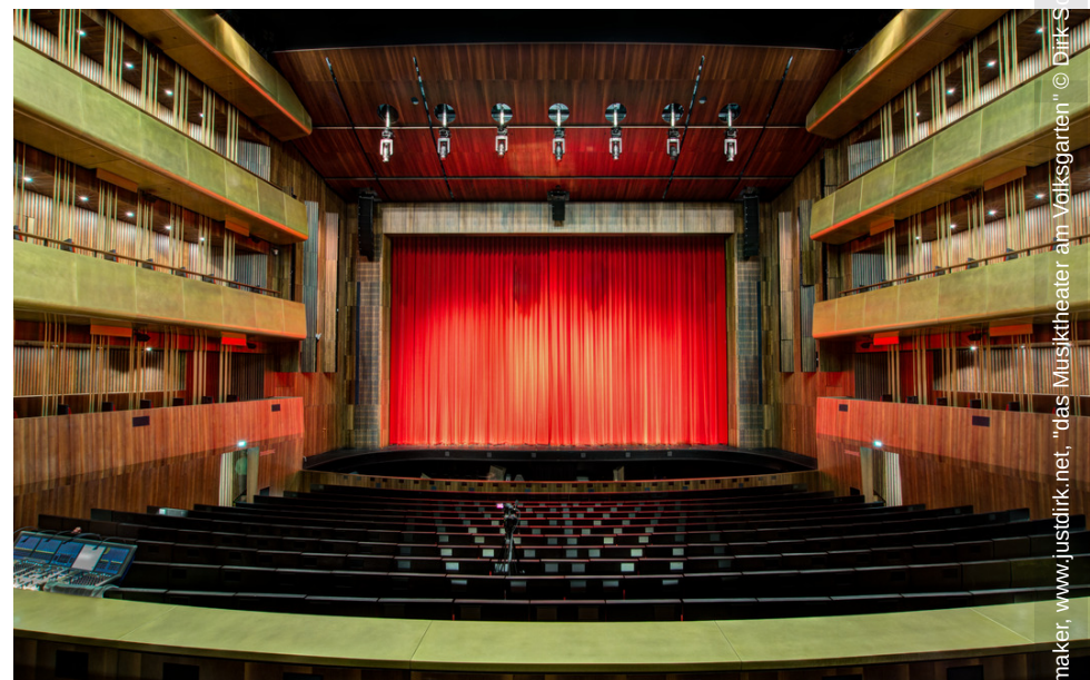
rik. Schoenmaker, www.justdirk.net, "das Musiktheater am Volksgarten" © Dirk Schoenmaker, www.justdirk.net, "das Musiktheater am Volksgarten"