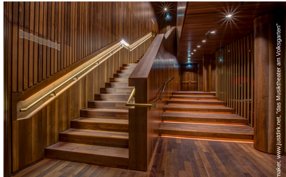
rik. Schoenmaker, www.justdirk.net, "das Musiktheater am Volksgarten" © Dirk Schoenmaker, www.justdirk.net, "das Musiktheater am Volksgarten"