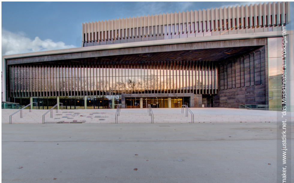
rik. Schoenmaker, www.justdirk.net, "das Musiktheater am Volksgarten" © Dirk Schoenmaker, www.justdirk.net, "das Musiktheater am Volksgarten"