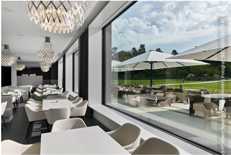
© S+P Albert Speer + Partner GmbH | Fotograf: BECKERLACOUR