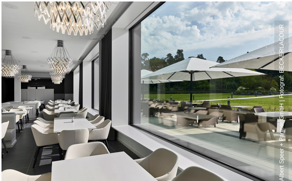
© AS+P Albert Speer + Partner GmbH | Fotograf: BECKERLACOUR