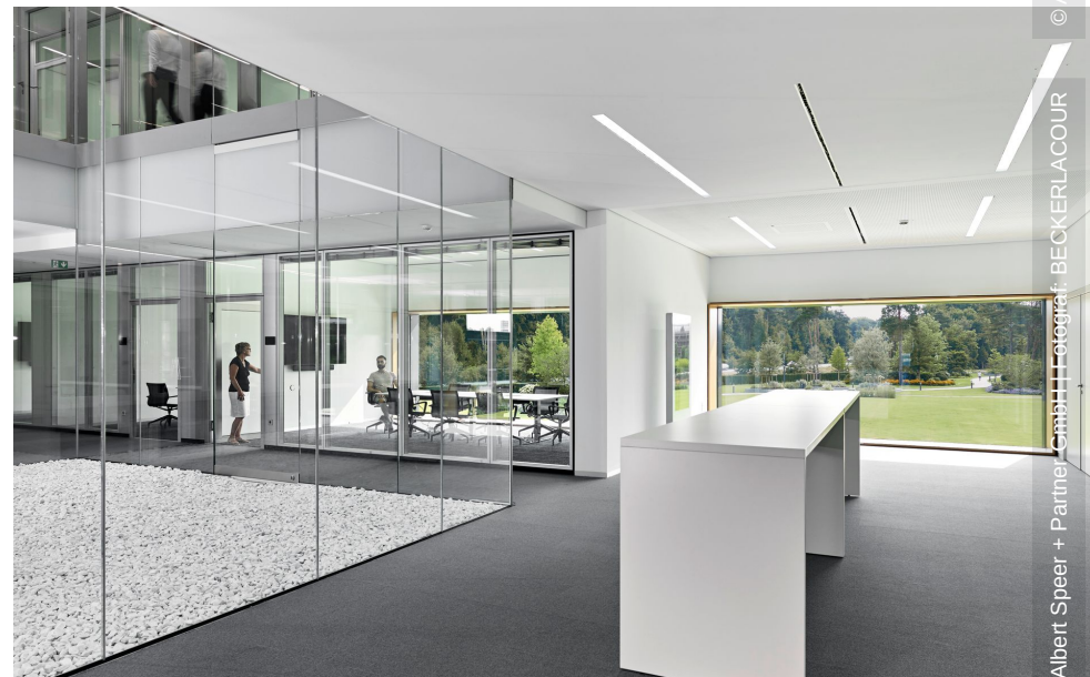
© AS+P Albert Speer + Partner GmbH | Fotograf: BECKERLACOUR