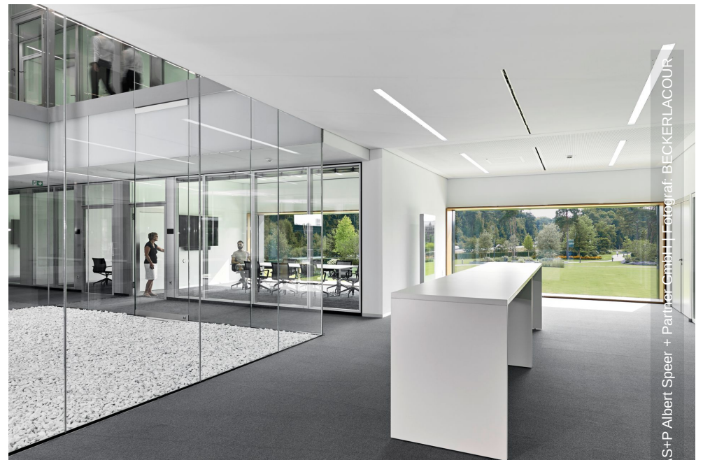
S+P Albert Speer + Partner GmbH