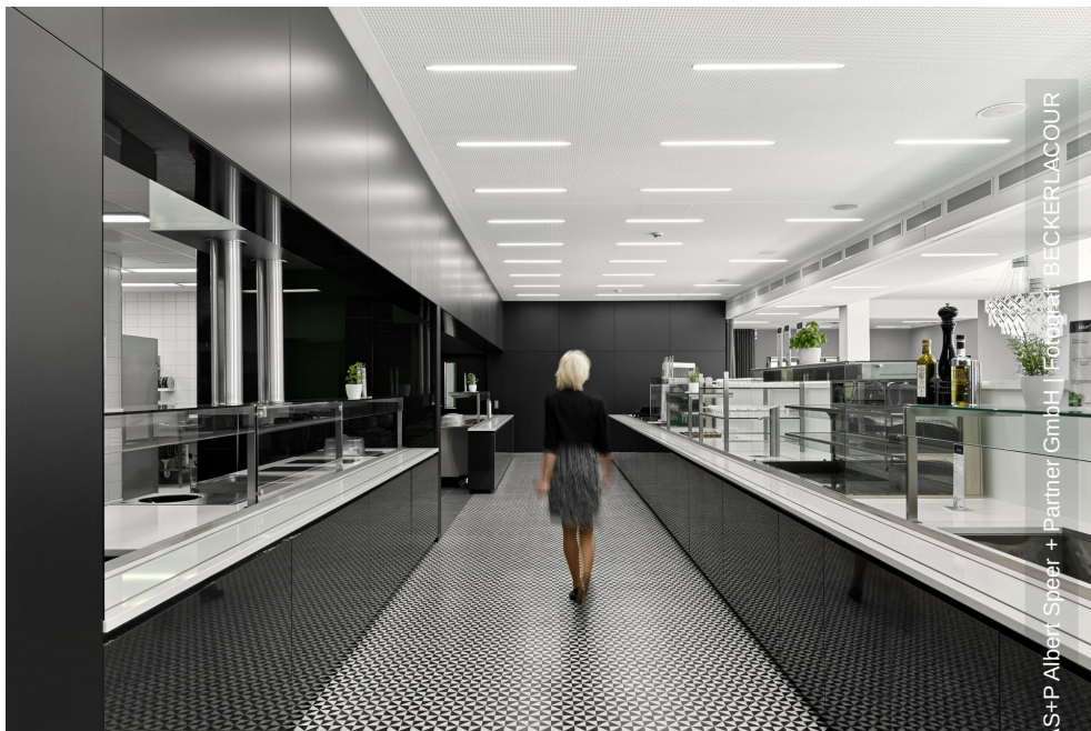
S+P Albert Speer + Partner GmbH