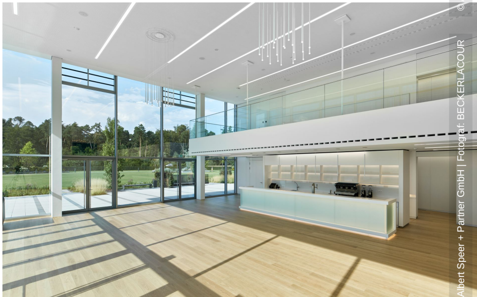
© AS+P Albert Speer + Partner GmbH | Fotograf: BECKERLACOUR