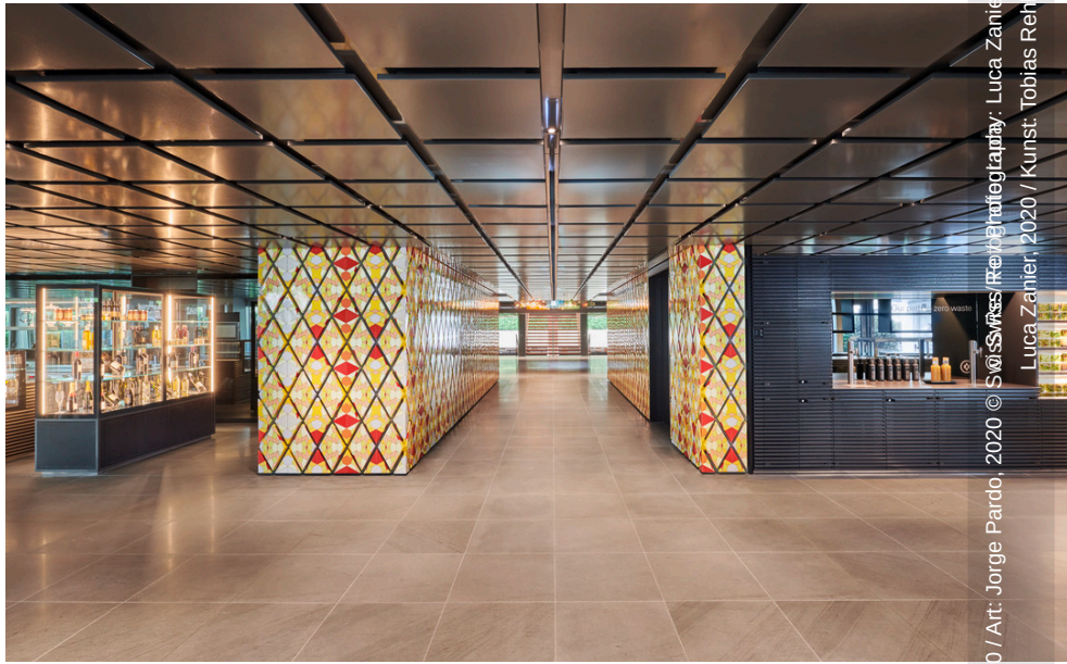
Art: Jorge Pardo, Tobias Rehberger, Paë White, 2020 / Kunst: Jorge Pardo, Tobias Rehberger, Paë White, 2020 / Art: Jorge Pardo, Tobias Rehberger, Paë White, 2020 / Kunst: Jorge Pardo, Tobias Rehberger, Paë White, 2020 / Fotografie: Luca Zanier, 2020 / Photography: Luca Zanier, 2020 / Swiss Re, 2020