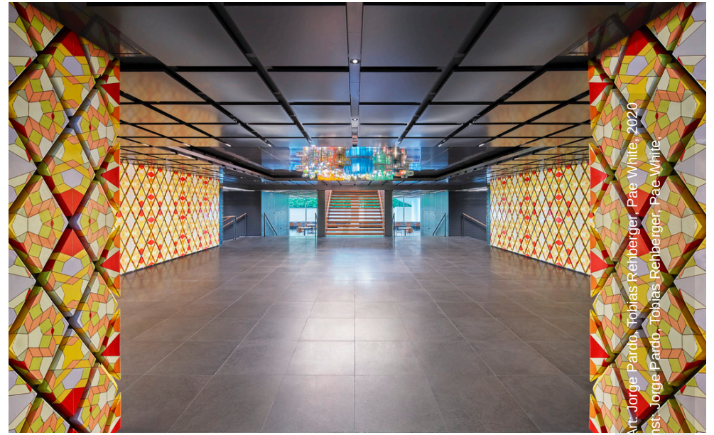
Art: Jorge Pardo, Tobias Rehberger, Paë White, 2020 / Kunst: Jorge Pardo, Tobias Rehberger, Paë White, 2020 / Art: Jorge Pardo, Tobias Rehberger, Paë White, 2020 / Kunst: Jorge Pardo, Tobias Rehberger, Paë White, 2020 / Fotografie: Luca Zanier, 2020 / Photography: Luca Zanier, 2020 / Swiss Re, 2020