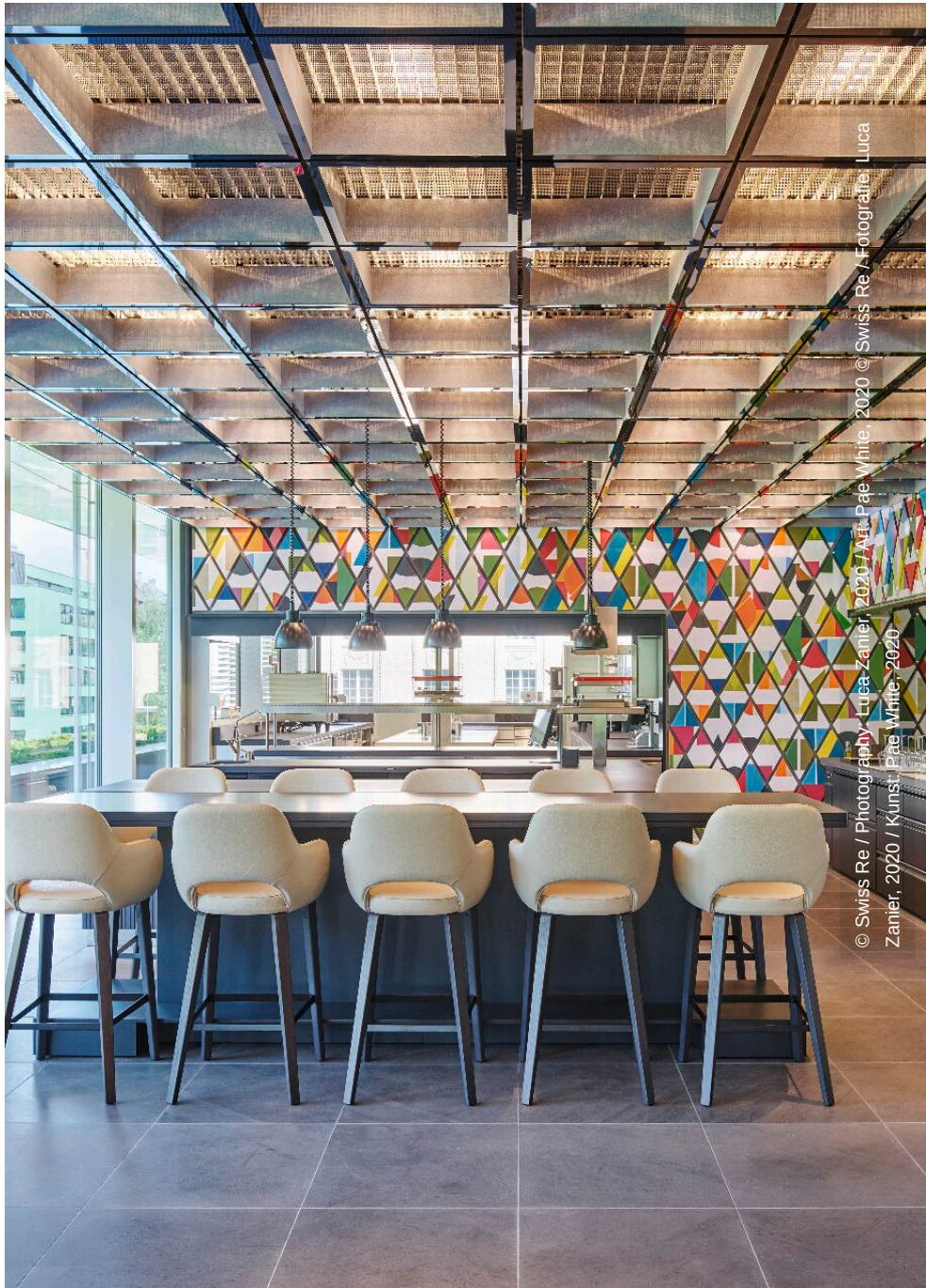
Art: Pae White, 2020 Kunst: Pae White, 2020