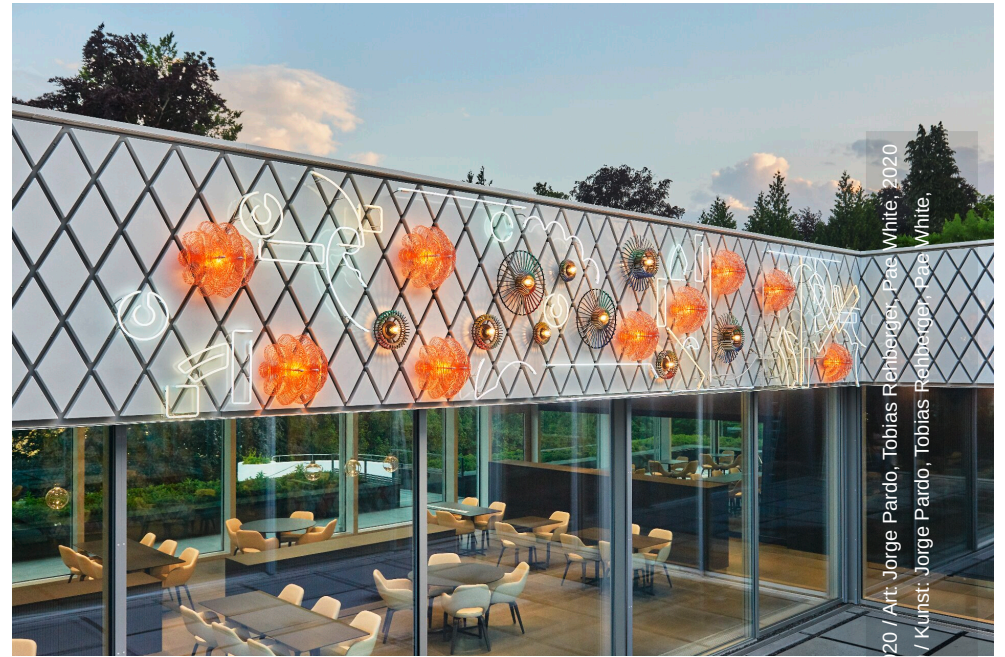
20 / Art: Jorge Pardo, Tobias Rehberger / Kunst: Jorge Pardo, Tobias Rehberger, Pae White, 2020 / Kunst: Jorge Pardo, Tobias Rehberger, Pae White, 2020