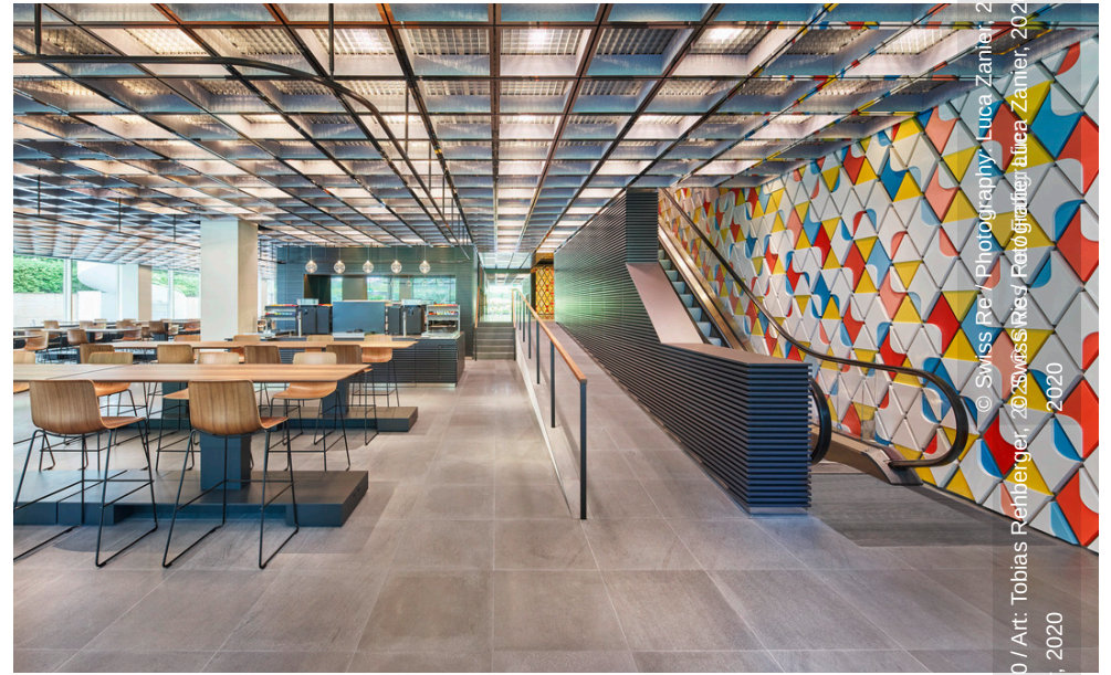
Art: Jorge Pardo, Tobias Rehberger, Paë White, 2020 / Kunst: Jorge Pardo, Tobias Rehberger, Paë White, 2020 / Art: Jorge Pardo, Tobias Rehberger, Paë White, 2020 / Kunst: Jorge Pardo, Tobias Rehberger, Paë White, 2020 / Fotografie: Luca Zanier, 2020 / Photography: Luca Zanier, 2020 / Swiss Re, 2020